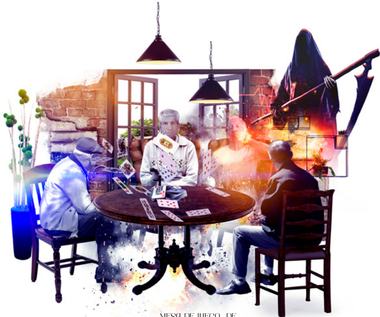
MESA DE JUEGO DE BARAJAS